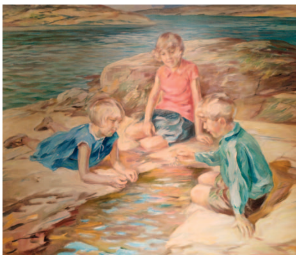
«Lekende barn ved stranden»