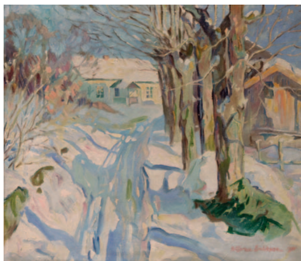
«Vakker vinterdag på gården 1921»

068/2 Olje på lerret 80 x 105 sign.n.t.h. REK