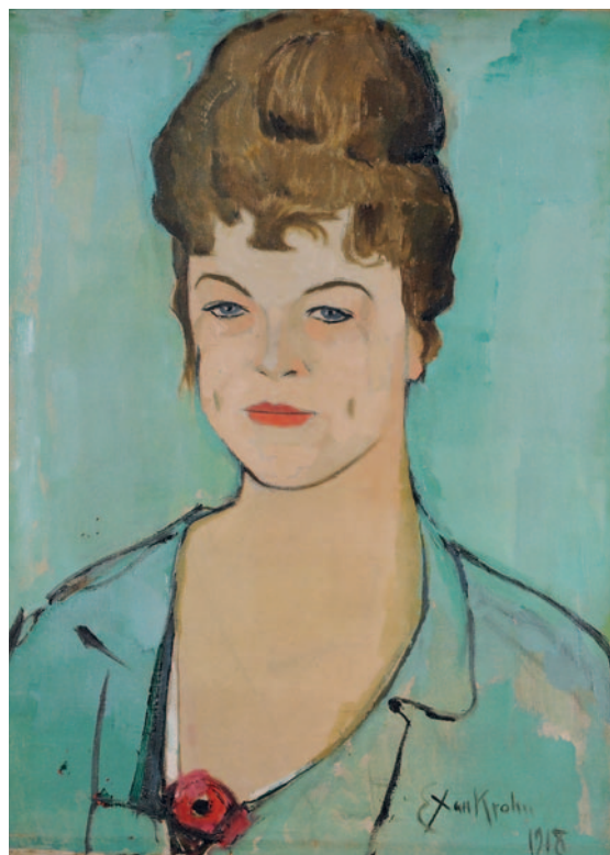
Kvinneportrett 1918 (Valentine Rostin)

058/1 1912 Olje på lerret 64 x 75 sign. og dat n.t.h.