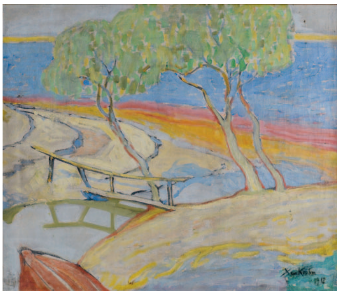
Landskap med bro

058/3 Olje på lerret 55 x 43 sign. og dat. n.t.h. 1917.